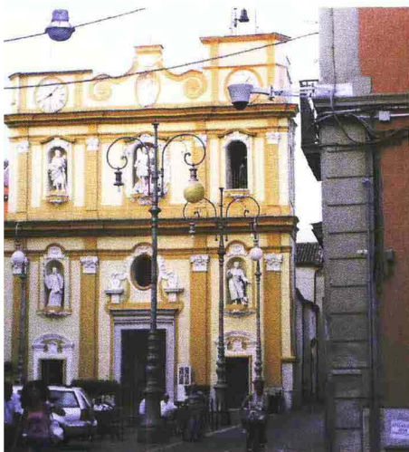
PIAZZA Nella piazza della chiesa, lungo le principali strade ed incroci sono state installate cinque Axis 232+ DOME PTZ con funzioni di GuardTour

Operatori Progettazione e installazione di Bitsolution Srl, Casalnuovo (NA)